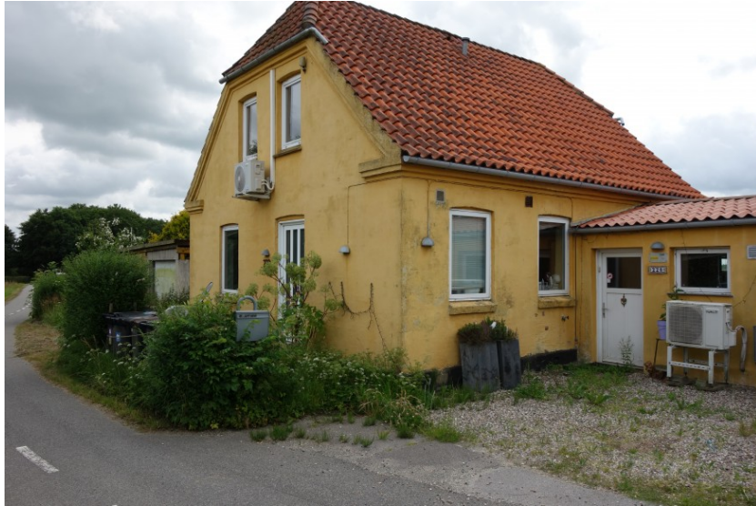
Huset set fra vejen