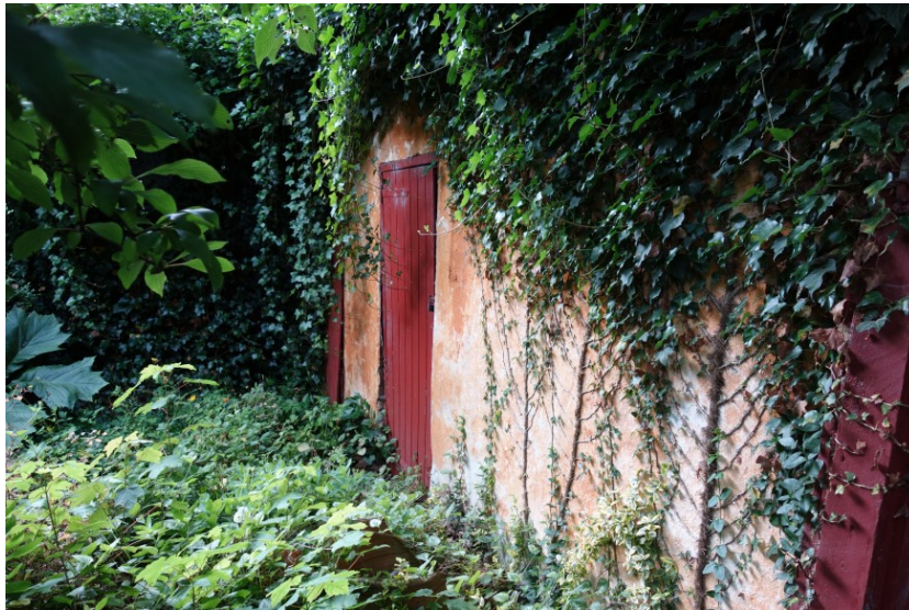
Udhus ved garage