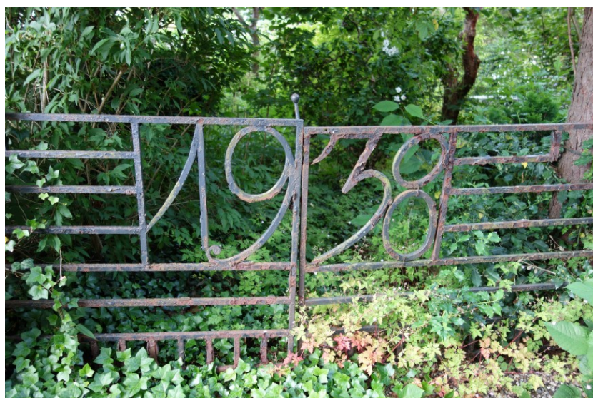
Låge til haven